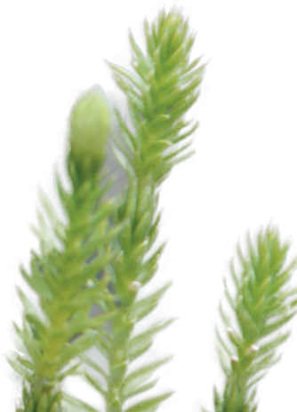
Lumme är en del av Notkojuddens flora

Från Ramsberg, kör mot Löa och följ vägvisning vid norra änden av Ölsjön. Alternativt ta av mot Ölsjöbadet och följ vägvisning till norra änden av sjön. Vid entrén finns en eldplats och en trevlig strand med sandbotten. En kuperad stig leder längst ut på udden.