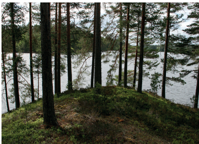
Notkojuddens yttersta spets.

Rullstensåsar är spåren efter väldiga isälvar som flöt under inlandsisen. När isen smälte undan sjönk det material som älvarna fört med sig ned till marken och bildade åsarna.