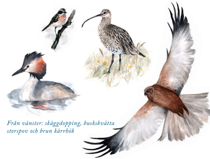
Från vänster: skäggdopping, buskqvätta, storspov och brun kärnhök

Andra fåglar man ofta ser vid Näset är den eleganta fisktärnan som störtdyker efter fisk och den bruna kärnhöken med sin typiska långsamma jagande flykt omväxlande med glid. Då och då ser man den stora fiskgusen uppe i luften då den ryttlar för att i nästa stund dyka huvudstupa ner i vattnet och komma upp med en fisk i klorna.