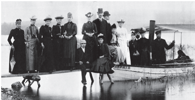
Ett sällskap med ångaren Zephyr vid 1900-talets början

Reservatet gränsar i väster till en kanal som grävdes i början av 1900-talet för att båtar med brunngäster skulle kunna ta sig fram. Idag är kanalen igenvuxen och hälsobrunnen sedan länge borta.