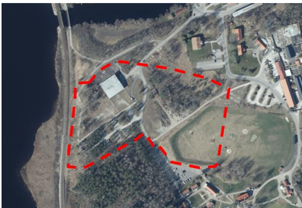
Planområdets placering i tätorten, markerad med röd linje.

Planområdet är beläget söder om centrala Lindesberg. Området avgränsas av Dalkarlshytteån i norr, järnvägen i väster, golfklubbens stugby och naturreservatet Tempelbacken i söder och Masugnens skolområde i öster. Planområdets area är ca 46 000 m 2 .