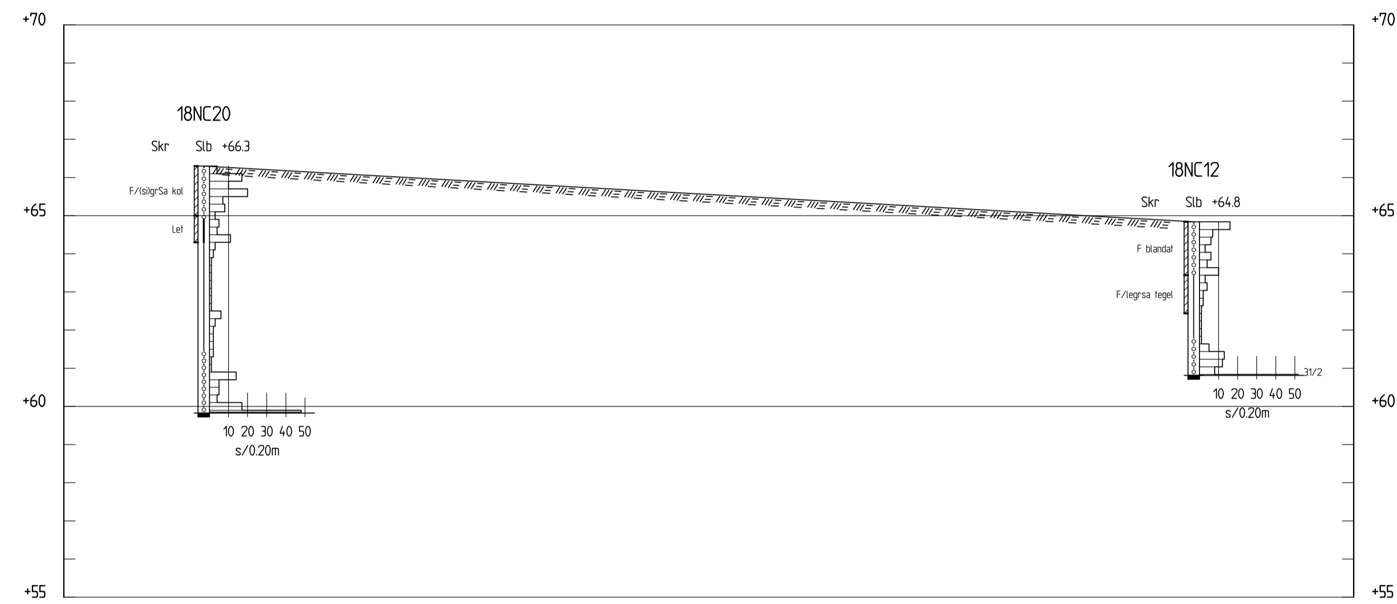
SEKTION B-B H 1: 100 L 1: 500