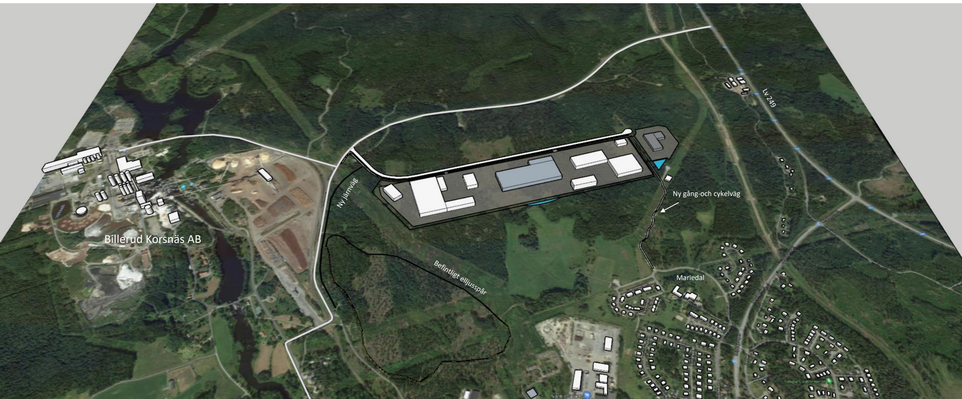
Illustration tillhörande detaljplan för del av Mariedal 1:1 m fl (norra verksamhetsområdet, etapp 1) Illustrationen visar på ett exempel av vad byggrätterna i planförslaget tillåter.

Illustrationen förtydligar Plankartan men är i sig inte en juridisk handling.