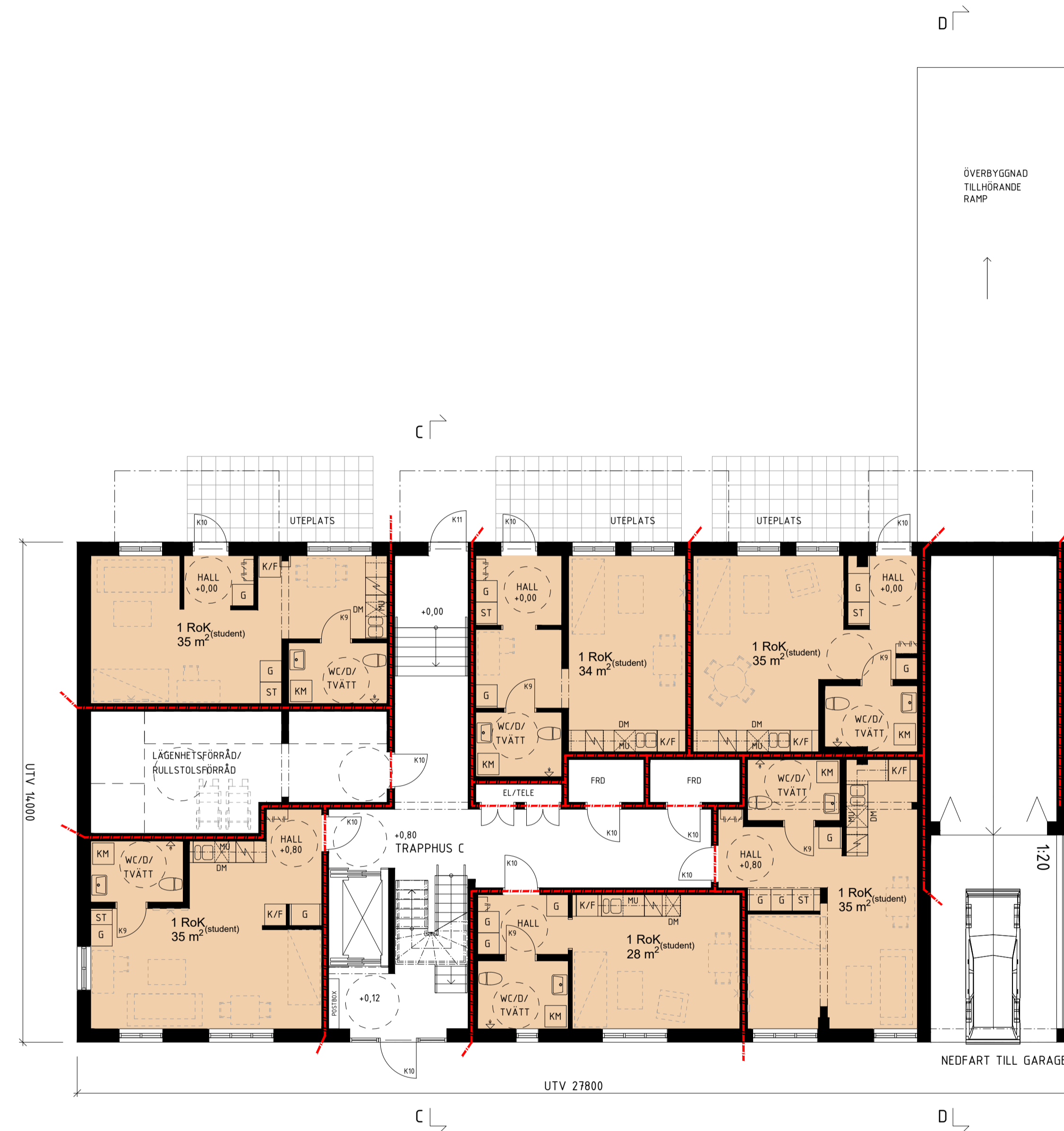
HUS 2 PLAN 10, BOTTENVÅNING